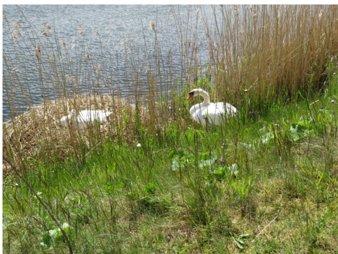
Rugende Knopsvane i bassin 11, senere forladt.