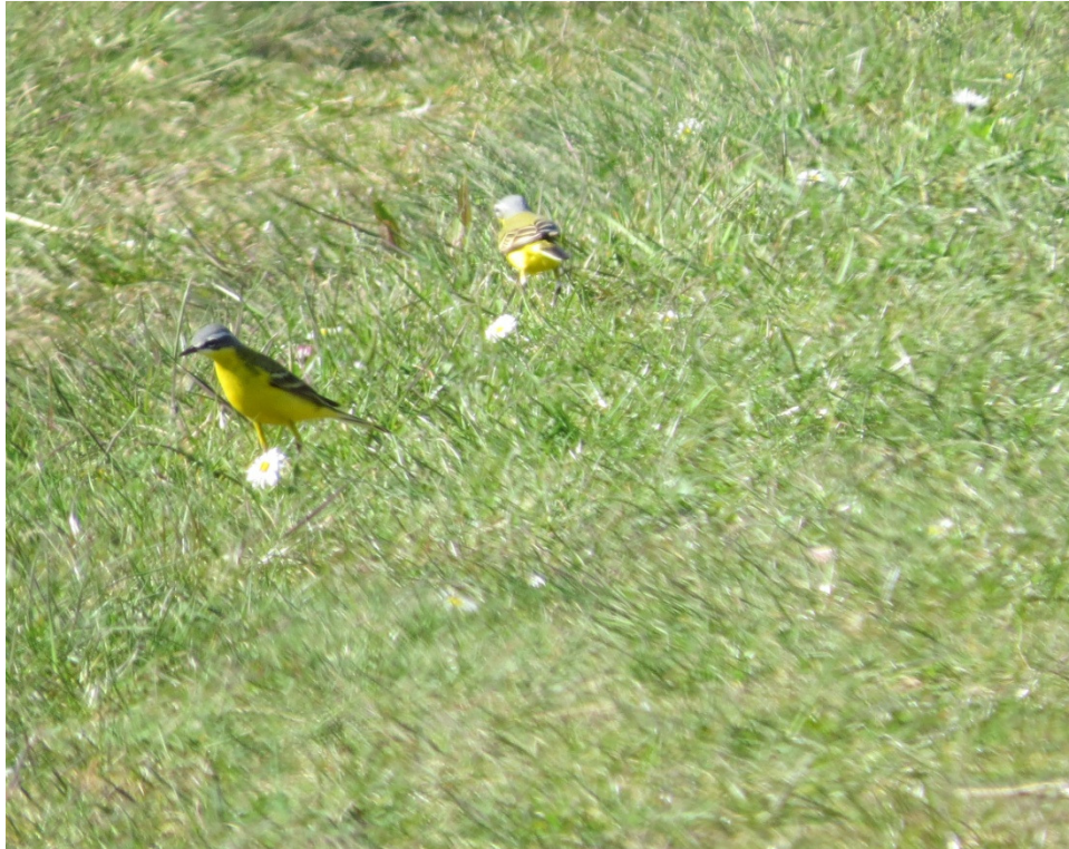
God sæson for Gul Vipstjert i bassinerne.