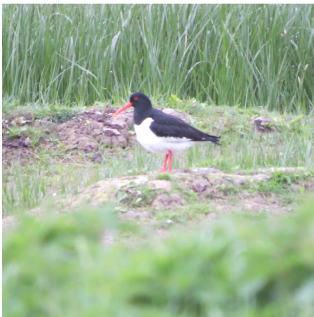
Strandskade på øen i bassin 15.

1 opholdt sig i en periode i bassin 15 uden tegn på ynglen.