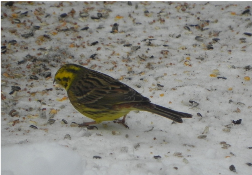
Gulspurv 15. februar.

Bassin 4: 1 par. Bassin 13: 1 par. Bassin 15: 1 par. Sydhegnet: 1 par. Nordhegnet: 1 par.