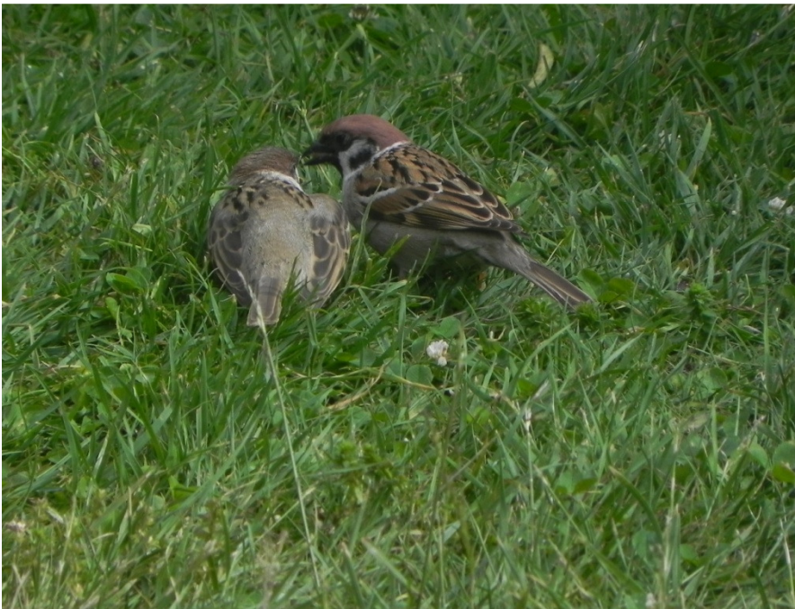
Skovspurv ved bassin 15, 27. maj.

Bassin 4: 2 par. Basin 15: 2 par. Sydhegnet: 6 par. Nordhegnet: 3 par.