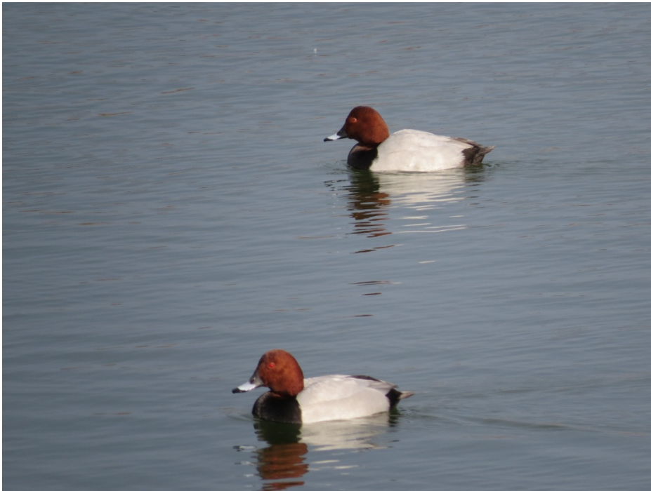
Taffeland er faste gæster i bassinerne.