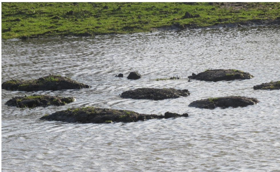
Småøerne i bassin 15.

Der blev lagt 6-7 toppe på øen, så de danner småøer ved største højvande i forårssæsonen. Det har i 2015 virket efter hensigten.