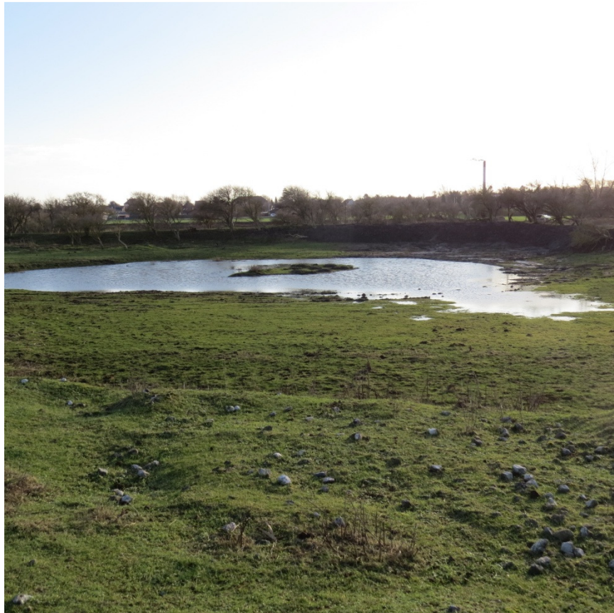
Den nyetablerede ø i bassin 15 marts 2015

Vordingborg kommune Afdeling for Land og Miljø