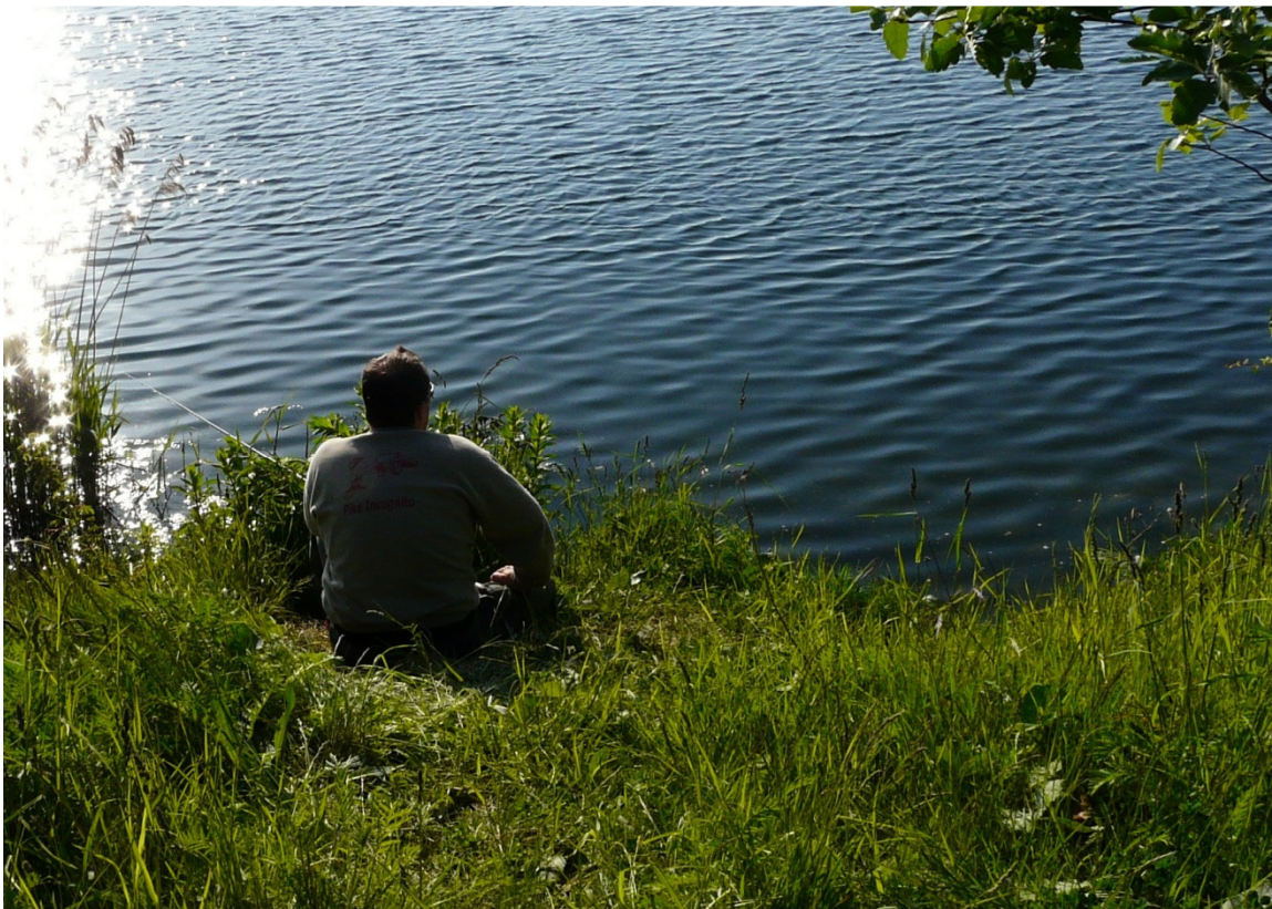
Lystfisker fra tidligere sæson i bassinerne

Problemer med ulovligt lystfiskeri, bl.a. fra karpefiskere.