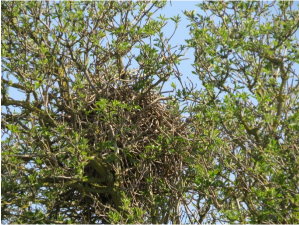
Husskade rede april bassin 15.