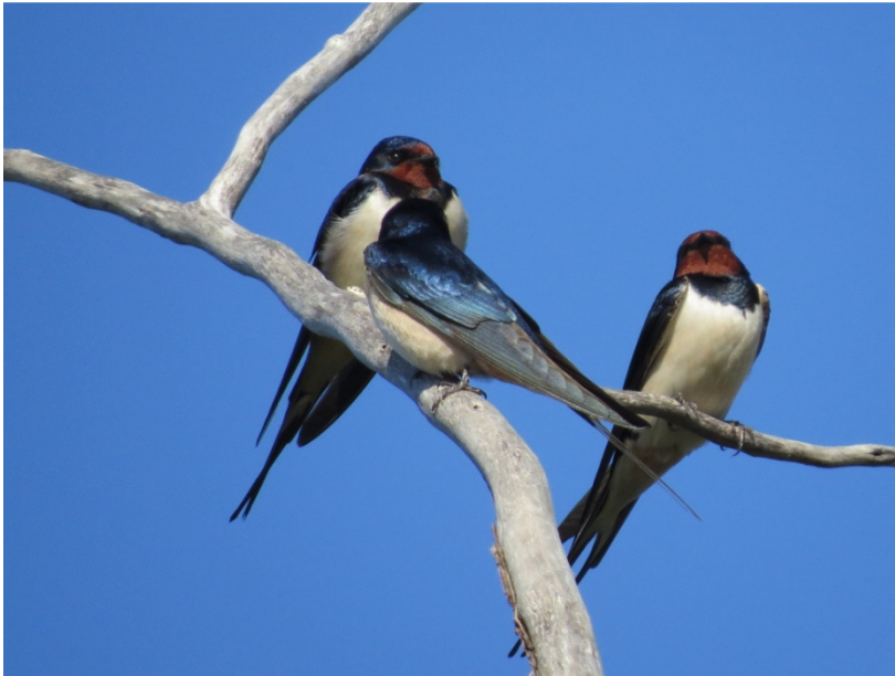
Landsvaler raster i buskene ved bassinerne 24. april.