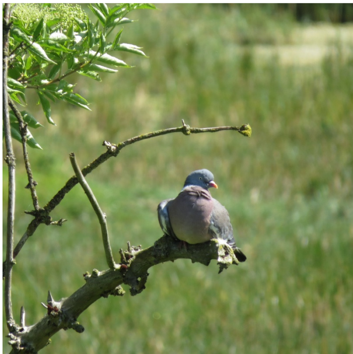
Ringdue i bassin 4 den 11. juni

Bassin 2: 2 par. Bassin 3: 1 par. Bassin 4: 1 par. Bassin 15: 1 par. Bassin 16: 1 par. Sydhegnet: 1 par.