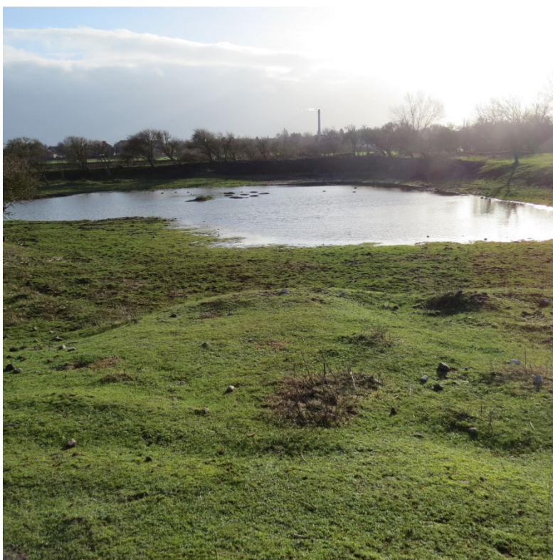
Småøer i høj vandstand bassin 15 i april

Vejrforholdene i bassinerne var generelt præget af frostfrie vintermåneder og hen gennem foråret gråt, blæsende og fugtigt indtil slutningen af maj og ind i juni. Jeg fik efter aftale med kommune og entreprenør omsider etableret en ø med 6-7 "toppe" og uddybning omkring øen i bassin 15. Det har været interessant at følge fuglearternes brug af biotopen og konstateret ynglende Blishøne, Gråand og muligvis Hættemåge, sidstnævnte dog antagelig med flytning til bassin 16 og senere iagttaget med 2 juvenile unger. Rastende arter i længere perioder har bl.a. omfattet Fiskehejre, Gravand, Gråand, Knarand, Skeand, Krikand, Pibeand, Strandskade, Vibe, Stor Præstekrave, Rødben, Hvidklire og Mudderklire.