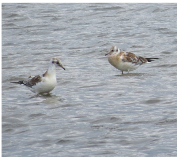
2 unge Hættemåger i bassin 15 d. 14. juli.