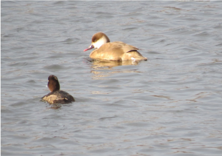
Rødhovedet And, hun, 15. februar