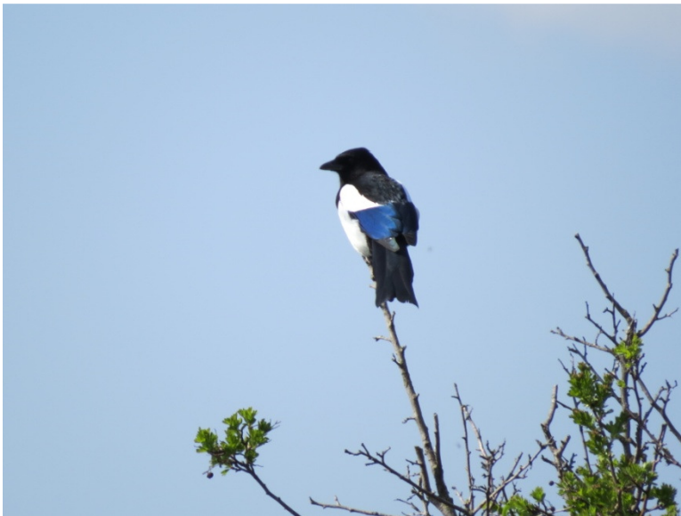
Husskade i bassin 15.

Bassin 2: 1 par. Bassin 4: 1 par. Bassin 15: 1 par. Bassin 16: 1 par. Sydhegnet: 2 par. Nordhegnet: 2 par.